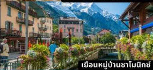
เยือนหมู่บ้านซาโมนิช