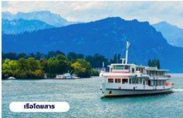
เรือโดยสาร