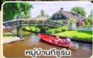
หมู่บ้านทึร์น