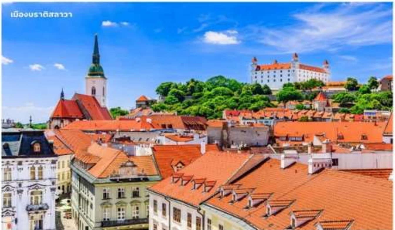
เมืองบราติสลาวา

จากนั้นนำท่านเดินทางสู่ เมืองบราติสลาวา ประเทศสโลวาเกีย ใช้เวลาเดินทางประมาณ 3 ชั่วโมง หรือมีชื่อเรียกอย่างเป็นทางการคือ สาธารณรัฐสโลวัก เป็นประเทศขนาดเล็กที่เพิ่งเข้าร่วมเป็นสมาชิกใหม่ของสหภาพยุโรป เป็นประเทศไม่มีทางออกสู่ทะเล แต่เมืองหลวงแห่งนี้เป็นเมืองที่มีชีวิตชีวาและยังเต็มไปด้วยวัฒนธรรมเก่าแก่ จากนั้นนำท่านถ่ายรูป ปราสาทบราติสลาวา ปราสาทเก่าแก่ที่ตั้งอยู่เหนือแม่น้ำดานูบ เมื่อขึ้นไปบนจุดที่ตั้งของปราสาทจะมองเห็นวิวทิวทัศน์เมืองสโลวาเกียได้ทั่วทั้งเมือง จากนั้นนำท่านเดินทางสู่ ย่านเมืองเก่าบราติสลาวา เป็นที่ตั้งของ ประตูมิคาเอล (Michael's Gate) เป็นประตูและป้อมปราการของเมืองเพียงแห่งเดียวที่ยังคงถูกเก็บรักษาไว้ตั้งแต่สมัยศตวรรษที่ 14