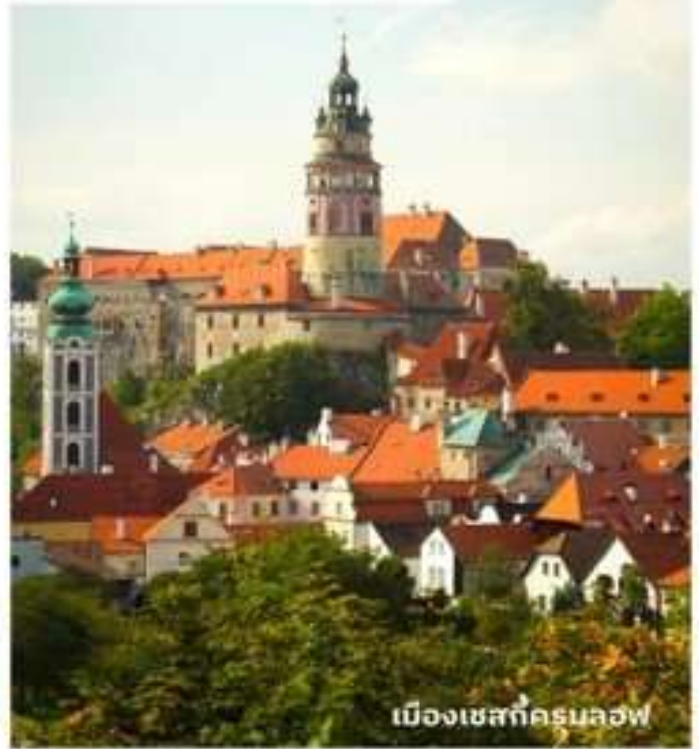
เมืองเชสที่ครุมลอฟ

อิสระให้ท่านเดินเที่ยวชมเมืองโบราณตามอัธยาศัย