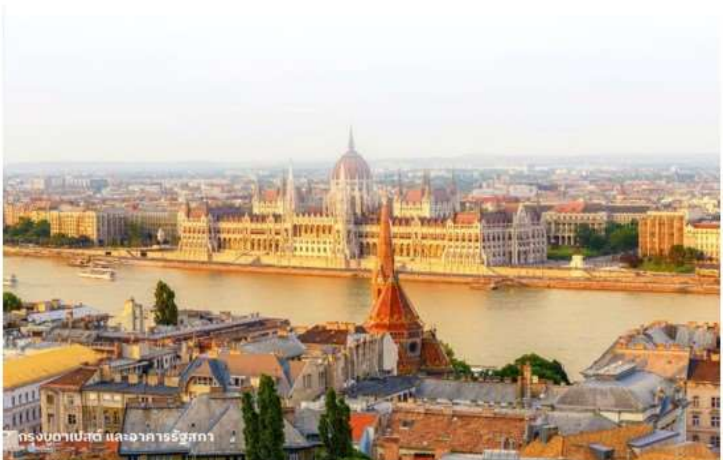
กรุงบูดาเปสต์ และอาคารรัฐสภา

นำท่านเข้าสู่ที่พัก Park Inn By Radisson Budapest หรือเทียบเท่า