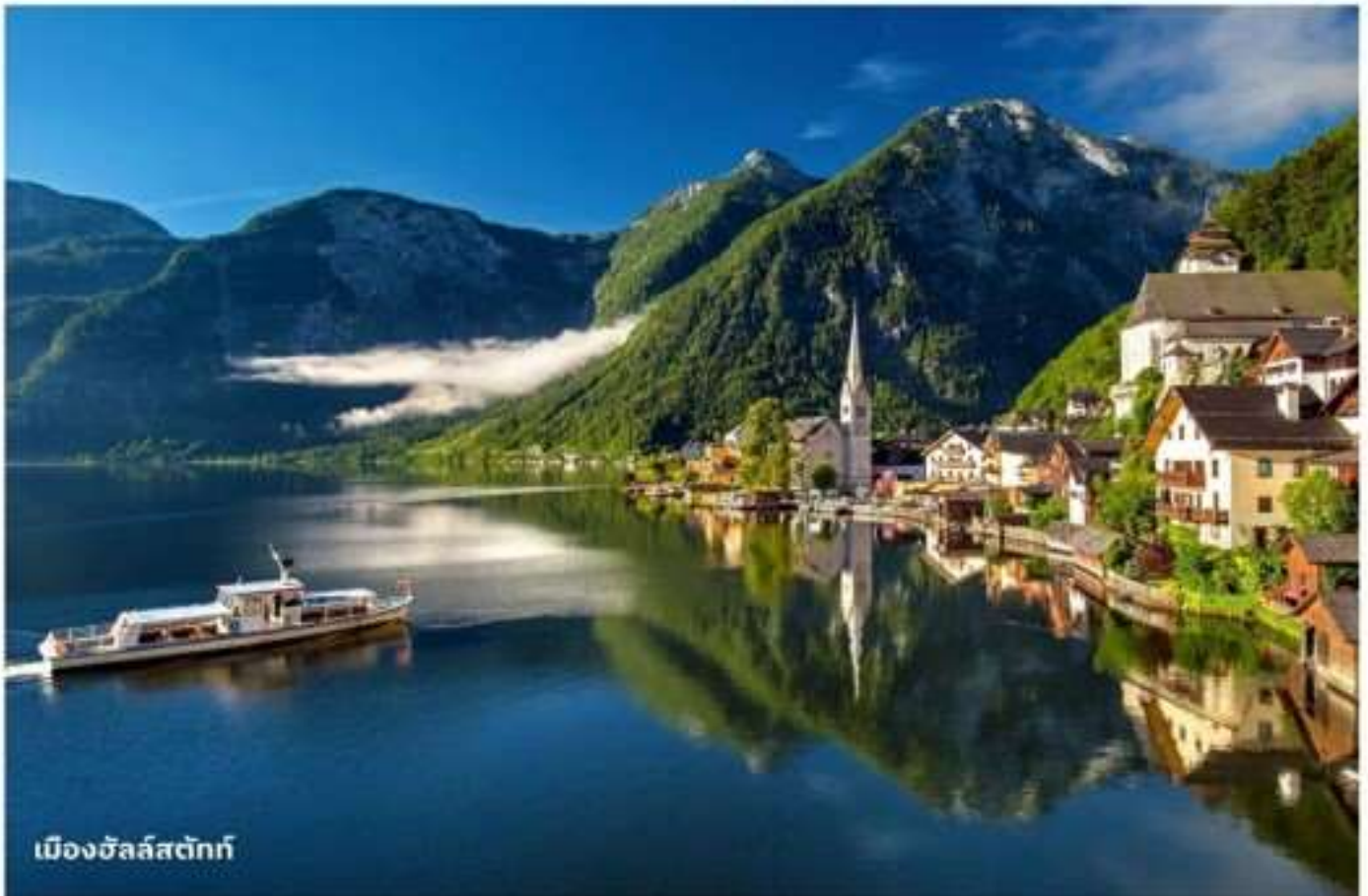
เมืองฮัลล์สตัดท์