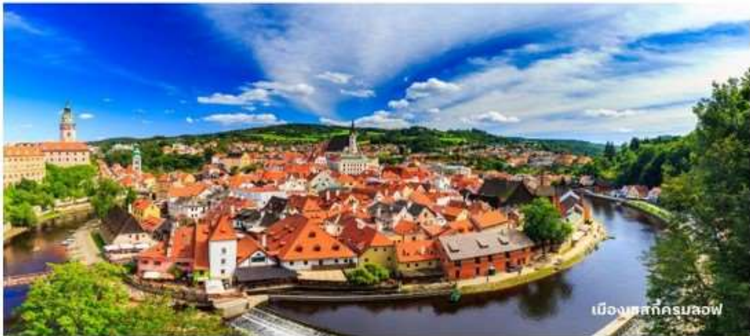
เมืองเชสที่ครุมลอฟ

นำท่านเข้าสู่ที่พัก Hotel Bellevue Cesky Krumlov หรือเทียบเท่า