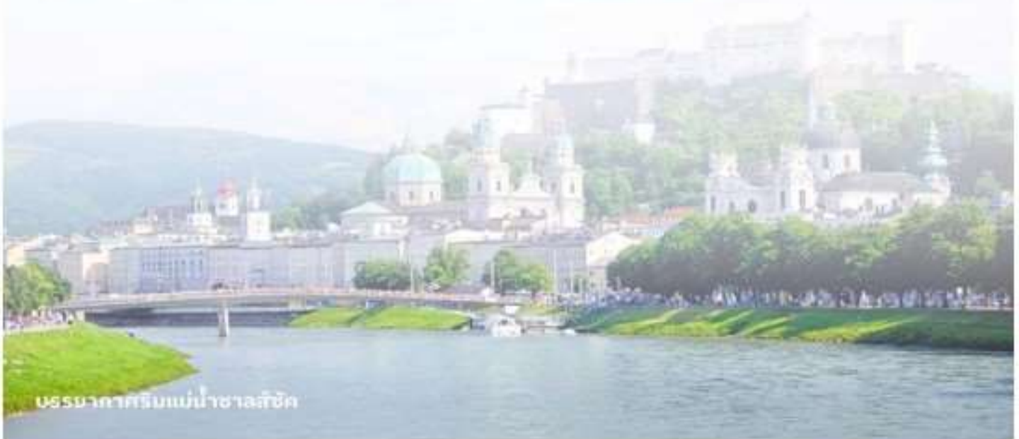
บรรยากาศริมแม่น้ำซาลส์บวร์ค

บริการอาหารค่ำ ณ กัตตาการ นำท่านเข้าสู่ที่พัก FourSide Salzburg หรือเทียบเท่า