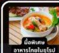
มือพิเศษ อาหารไทยในยุโรป