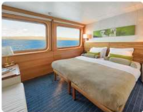
Junior Suite Plus & Junior Suite