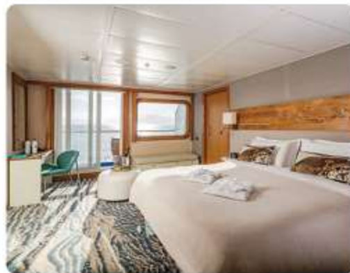
Balcony Suite Plus & Balcony Suite