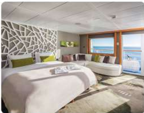
Legend Balcony Suite