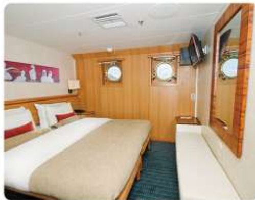
Junior Suite Plus & Junior Suite