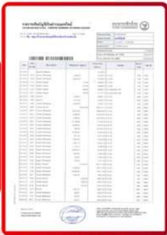
ตัวอย่าง Bank Statement ที่ผู้สมัครต้องยื่นเอกสาร

3.4 ปรับสมุดบัญชีธนาคารตัวจริง และเตรียมไปในวันที่ยื่นวีซ่า