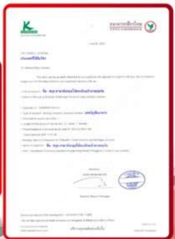
ตัวอย่าง Bank Guarantee ที่ผู้สมัครต้องยื่นเอกสาร