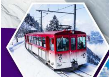
นั่งรถไฟใต้เขาริก