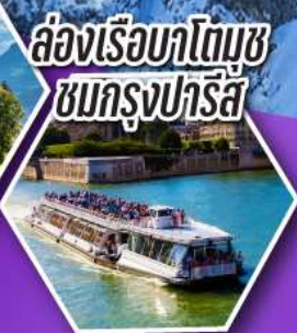
ล่องเรือบาโตมูซ ชมกรุงปารีส

เที่ยวเมืองวาอุซ เมืองหลวงของสาธารณรัฐ ลิกเทนสไตน์