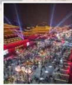
ถนนคนเดิน วัฒนธรรมต้าถัง