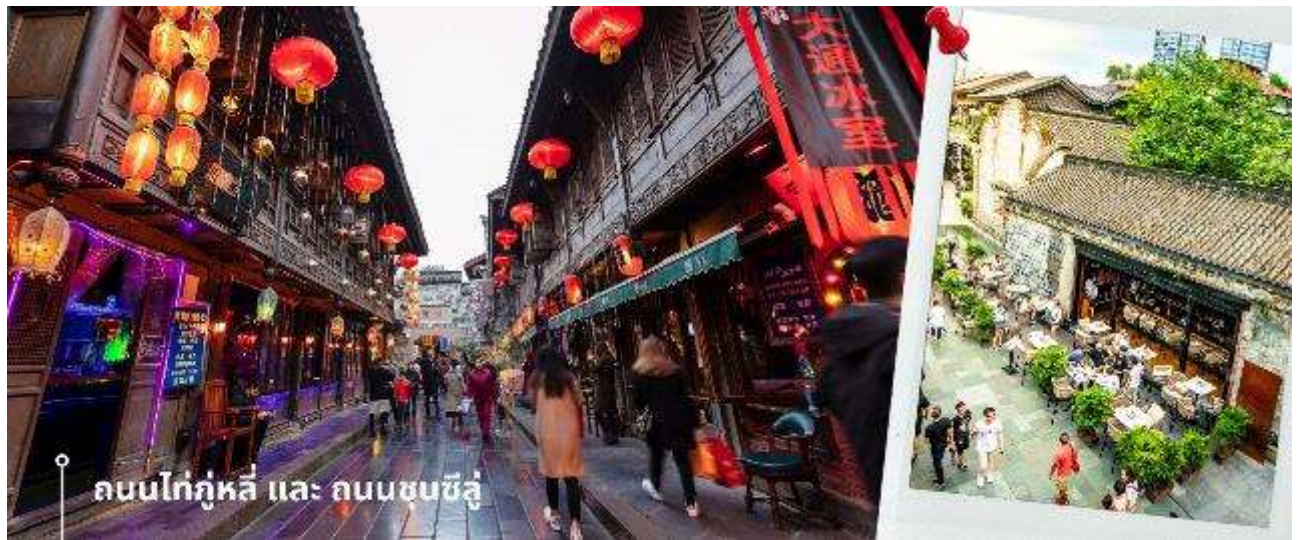
ถนนไท่กุ่หลี่ และ ถนนชุนซีลู่

จากนั้นให้ท่านให้อิสระกับการเลือกซื้อสินค้าของฝากที่ ถนนไท่กุ่หลี่ และ ถนนชุนซีลู่ ในย่านนี้เป็นถนนโบราณ ในอดีตเคยโรงงานผลิตผ้าไหมใหญ่ที่สุดในจีน ปัจจุบันได้เปลี่ยนเป็นถนนช้อปปิ้งแหล่งสวรรค์ของนักท่องเที่ยว เป็นถนนคนเดิน มีห้างสรรพสินค้าชื่อดัง มีร้านค้ามากกว่า 700 ร้านค้าที่เต็มไปด้วยสินค้าต่าง ๆ ทั้งร้านค้าแฟชั่น ร้านอาหารและโรงแรมนานาชาติมากมายซึ่งเป็นที่ยอดนิยมที่มีการเชื่อมต่อทางวัฒนธรรมท้องถิ่นที่เป็นแหล่งช้อปปิ้งและเป็นแหล่งร้านอาหารที่อร่อยต่าง ๆ มากมาย ซึ่งเป็นสถานที่เที่ยวของเฉิงตูที่ทำให้เพลิดเพลินกับสินค้าแบรนด์เนมและแบรนด์จีน เพื่อให้นักท่องเที่ยวได้เลือกซื้อตามอิสระ แะร้าน POP MART