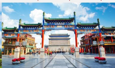
ถนนโบราณเจียนเหมิน