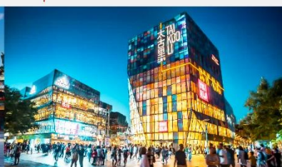
ย่านซุนหลี่ถุ่น

*ทางบริษัทฯ ขอสงวนสิทธิ์ในการสลับโปรแกรมทัวร์ตามความเหมาะสมขึ้นอยู่กับสถานการณ์หน้างาน โดยคำนึงถึงผลประโยชน์ของลูกค้าเป็นสำคัญ