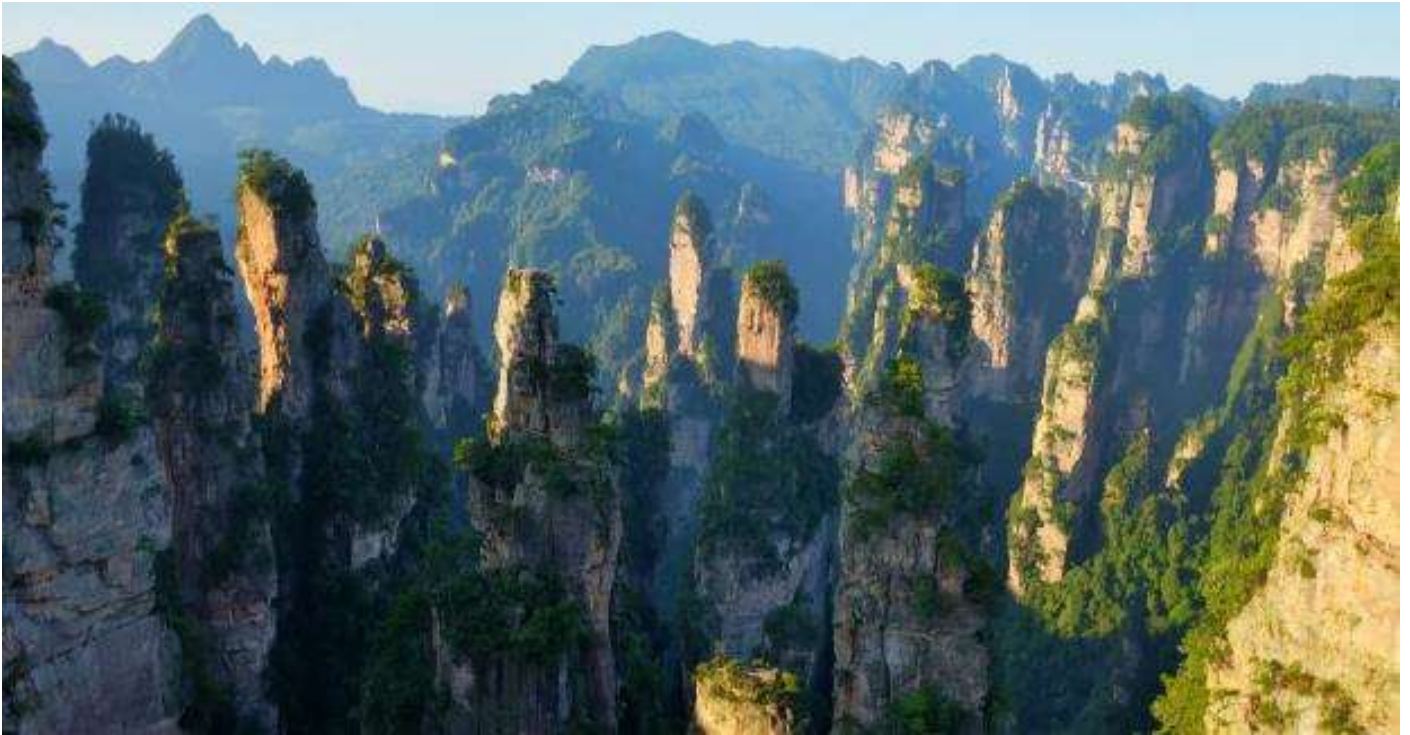
ของจางเจียเจี้ย

ท่านสามารถเลือกซื้อ Option เสริม! อุทยานจางเจียเจี้ย เปลี่ยนนั่งรถอุทยานนำท่านสู่ เขาวงตار โดยลิฟท์แก้วไปหลง เป็นลิฟท์แก้วแห่งแรกของเอเชียที่สร้างขึ้นเทียบหน้าผาสูงชัน มีความสูง 326 เมตร ท่านจะได้ตื่นตาตื่นใจกับยอดเขาฮาสิลุ่ยยา มีความสูงถึง 1,250 เมตร ชมทิวทัศน์อันสวยงามที่สุดแสนประทับใจ