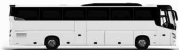
ตัวอย่างรถทัวร์ 1 ชั้น

ค่าที่พักตามที่ระบุในรายการหรือเทียบเท่าระดับเดียวกัน (ห้องพักละ 2 ท่าน) หากประเภทห้องพักท่านริเวเนสซาเกินจาก เช่น ริเวเนสซาห้องพักเป็น TWIN BED หรือ DOUBLE BED ทางบริษัทขอสงวนสิทธิ์ในการปรับประเภทห้องพัก เป็นตามโรงแรมมีอยู่ โดยไม่ต้องแจ้งให้ทราบล่วงหน้า