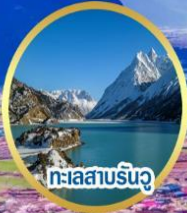
ทะเลสาบรินวู