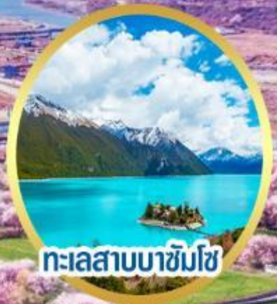
ทะเลสาบบาซิมโซ