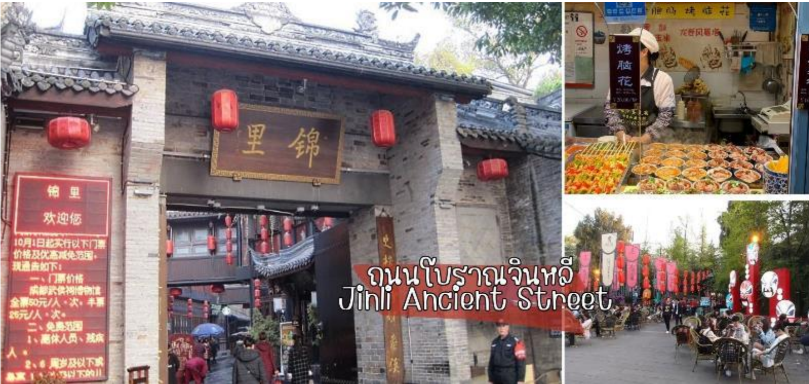
ถนนโบราณจิ่งหลี่ Jinli Ancient Street

และอื่น ๆ ให้ท่านเลือกชมและแวะซื้อกลับมา