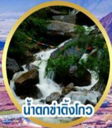
น้ำตกข่าตั้งโกว