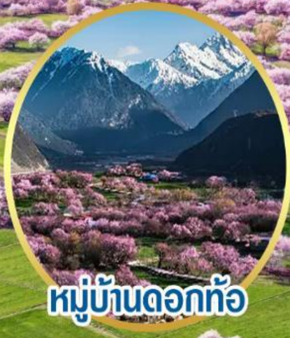
หมู่บ้านดอกท้อ