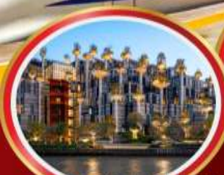
อาคารพินตันไม้