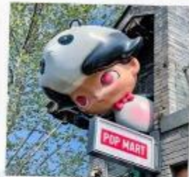
ชอยกวางแดบ