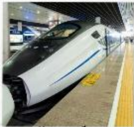
รถไฟความเร็วสูง สู่จิวจ้ายโกว