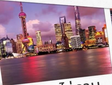
หาดไว่ทาน