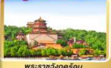
พระราชวังกุหลอรัน