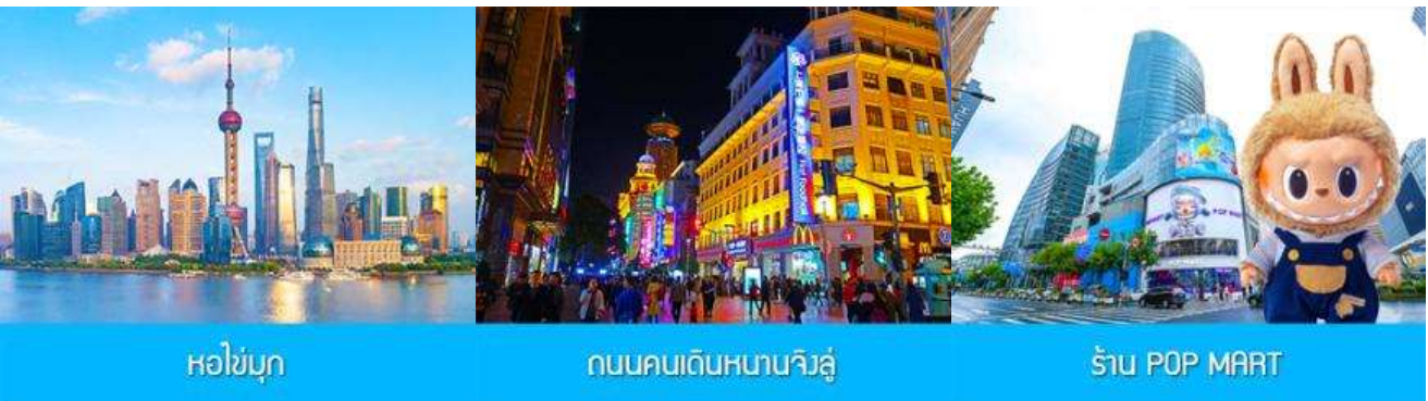
หอไข่มุก