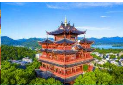
หอเจิงหวงเก๋อ