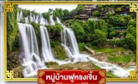
หมู่บ้านฟุทงเจิ้น