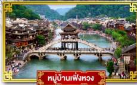
หมู่บ้านเฟิ่งหวง