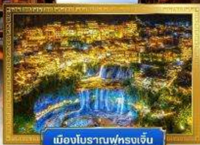
เมืองโบราณฟูหรงเจิ้น