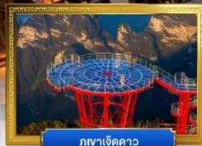
กุเขาเจ็ดดาว