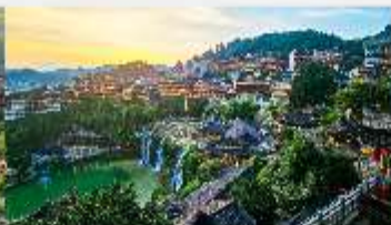
เมืองโบราณฟูหรงเจิน