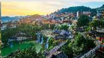
เมืองโบราณฟูหรงเจิน