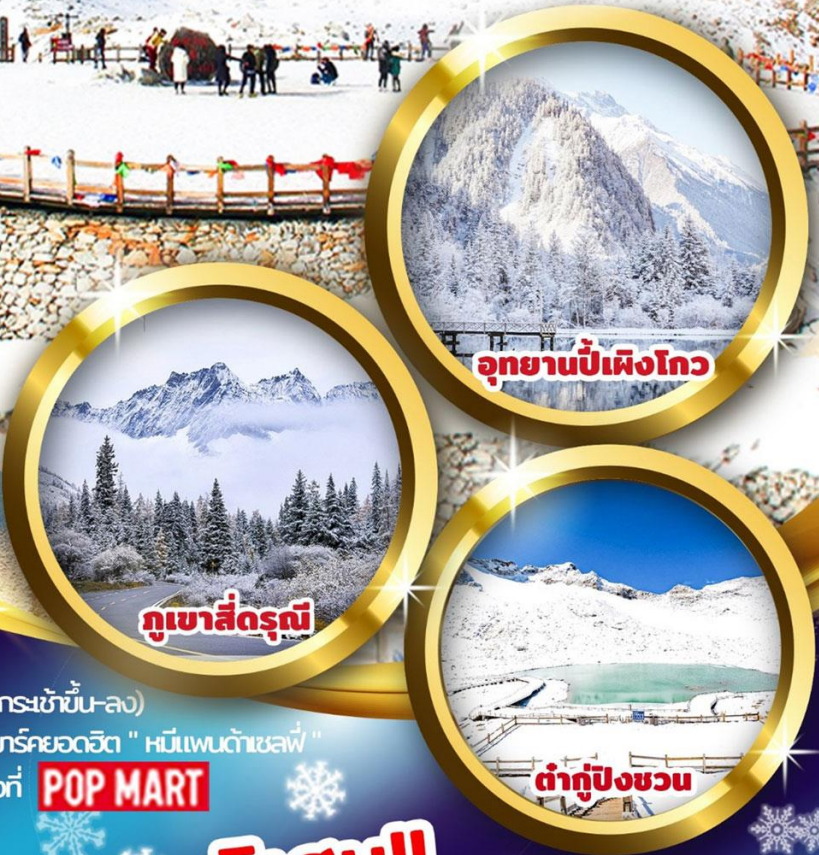
อุทยานปี้เผิงโกว