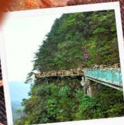
หมิงเยวี่ยซาน