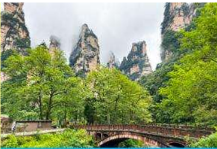
จุดชมวิวจิมเปียนซี