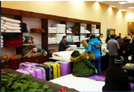
ศูนย์จำหน่ายผลิตภัณฑ์ยามพารา