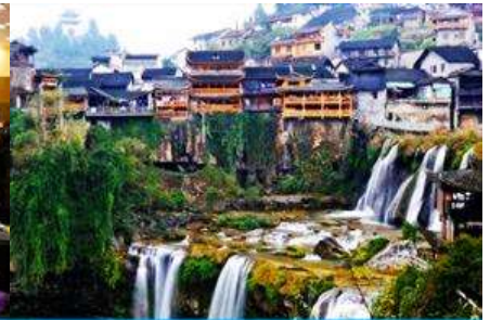
เมืองโบราณฟูหวงเจี๋ย