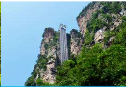
ลิฟท์แก้วไปหลวม