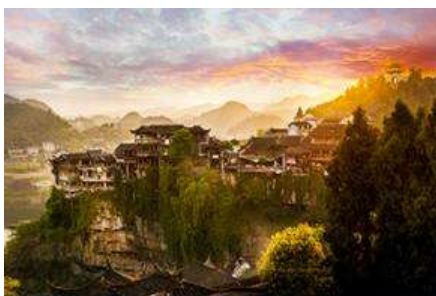
เมืองโบราณ ฝูหรงเจิ้น

เที่ยง รับประทานอาหารกลางวัน ณ ภัตตาคาร *หมูย่างเกาหลี