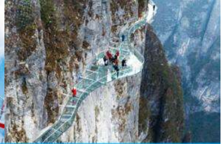
ระเบียงทางเดินเลียบบหน้าผา