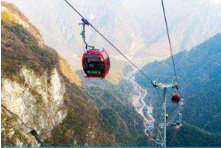
กระเช้าขึ้น/ลงเขาเจ็ดดาว

พักที่ ZHENMIN HOTEL โรงแรมระดับ 4 ดาวหรือเทียบเท่า