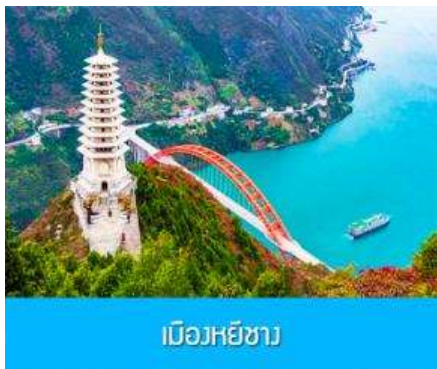
เมืองหยีซัง