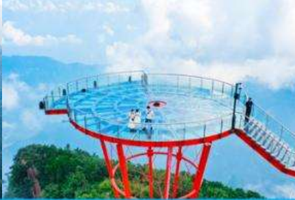
ระเบียงชมวิว Sky Eye