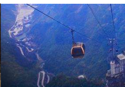
กระเช้าขึ้นเขาเทียนเหมินซาน