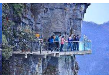
หน้าผาลอยฟ้าทางเดินกระแจะ