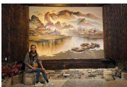
พิพิธภัณฑ์ภาพเขียนหีนทราย

พักที่ ZHENMIAN HOTEL OR YINXIANG HOTEL ระดับ 4 ดาวท้องถิ่นหรือเทียบเท่าในเมืองจางเจียเจี๋ย