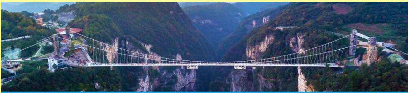
สะพานกระจกข้ามหุบเขาแกรนด์แคนยอน

โปรแกรมเสริมที่ 2 โปรแกรมเที่ยวชมอุทยานภูเขาอวตารแบบครึ่งวันที่รวมค่าขึ้นลิฟท์แก้ว (ผู้เข้าร่วมขั้นต่ำ 15 ท่าน) ใช้เวลาประมาณ 4-6 ชั่วโมง (ขึ้นอยู่กับจำนวนนักท่องเที่ยวในแต่ละวัน) อัตราค่าบริการท่านละ 750 หยวนหรือ 3,750 บาท นำท่านเที่ยวชมจุดชมวิวลำธารจีนเปียนซีที่สามารถมองเห็นวิวยอดเขาอวตารได้ชัดเจน นำท่านเที่ยวชมจุดชมวิวมณฑลฉุน ลานชมวิวน้ำลิฟท์แล้วไปหลมที่สามารถมองเห็นทัศนียภาพของภูเขาอวตารและลิฟท์แก้วได้ชัดเจน นำท่านขึ้นลิฟท์แก้วขึ้นสู่ยอดเขาอวตาร นำท่านเดินชมจุดชมวิวด่าง ๆ บนยอดเขาอวตารได้แก่ภูเขาฮาเลอูย่า สะพานหนึ่งในได้หล่า... อัตราค่าบริการรวม ค่าบัตรเข้าอุทยาน ค่ารถรับส่งภายในเขตอุทยาน ค่าน้ำเที่ยวของไกด์ท้องถิ่น