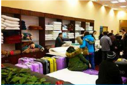
ศูนย์จำหน่ายผลิตภัณ์ที่ยางพารา

พักที่ ZHENMIAN HOTEL OR YINXIANG HOTEL ระดับ 4 ดาวท้องถิ่นหรือเทียบเท่าในเมืองจางเจี๋ยเจี๋ย