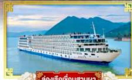
ล่องเรือเขื่อนสามผา