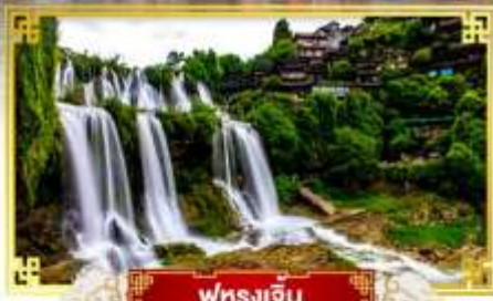
ฟุรงเจิน