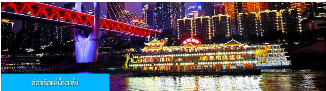
ล่องเรือแม่น้ำฉงชิ่ง