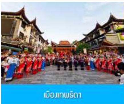
เมืองเทพริดา