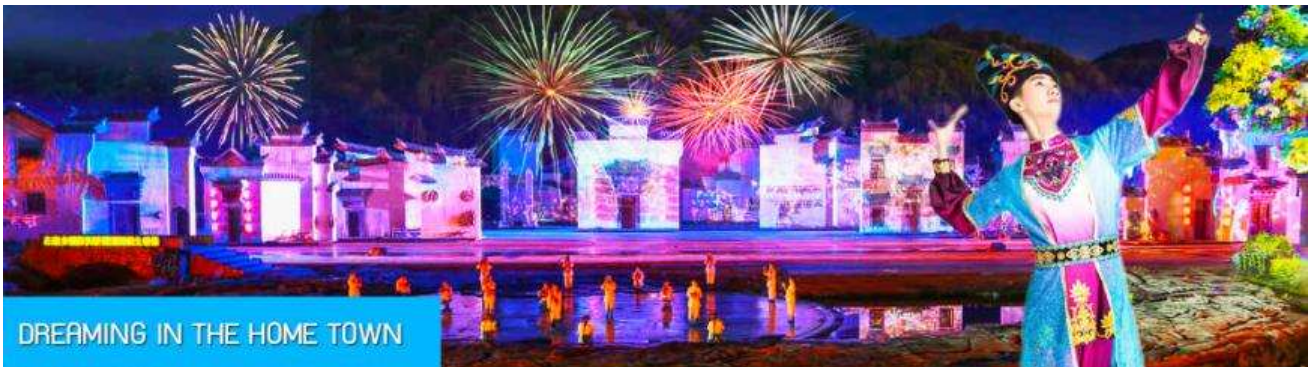
DREAMING IN THE HOME TOWN

หลังอาหารนำท่านเดินทางเข้าที่พัก หรือท่านสามารถเลือกซื้อโปรแกรมเสริม เป็นบัตรชมการแสดง ชุด DREAMING IN THE HOME TOWN เป็นการแสดงบนเวทีขนาดใหญ่ที่จัดสร้างขึ้นกลางแจ้ง ท่ามกลางธรรมชาติที่มีภูเขาเป็นฉากหลัง ใช้ทุนสร้างกว่า 280 ล้านบาท เป็นการแสดงที่น่าดูชมที่สุดในมณฑลเจียงซี แต่ละฉากการแสดงมีการออกแบบเวที ฉากประกอบที่พิถีพิถัน ประณีต และอลังการ ใช้ทีมงานนักแสดงหลายร้อยคน และระบบแสง สี เสียงที่ทันสมัยประกอบในการแสดง