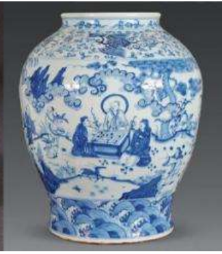
เตาเผาเครื่องลายครามจีนโบราณ

หลังอาหารนำท่านชม เตาเผาเครื่องลายครามจีนโบราณ 景德镇官窑 เป็นโรงงานผลิตเครื่องลายครามจีนโบราณที่ผลิตเครื่องใช้ต่าง ๆ (เครื่องลายคราม) อาทิ แจกันประดับบ้าน ถ้วยชาม บรรจุภัณฑ์ที่ใช้ในบ้าน เพื่อส่งถวายให้เป็นเครื่องใช้ในวังสำหรับจักรพรรดิ และพระบรมวงศานุวงศ์ เครื่องลายครามที่ผลิตจากโรงงานแห่งนี้ได้ชื่อว่าเป็นเครื่องลายครามที่ดีที่สุดในพื้นที่จีน ซึ่งของที่ผลิตได้ทุกชิ้นหลังผ่านการคัดกรองแล้วจะถูกส่งไป ในพระราชวังที่กรุงปักกิ่ง ส่วนที่เหลือจากการคัดกรองจะถูกทุบให้แตกและนำมาเผาใหม่ โดยไม่สามารถนำไปขายให้กับสามัญชนทั่วไปได้.....นำท่านชมเตาเผาโบราณ และเครื่องลายครามโบราณรุ่นต่าง ๆ ซึ่งบางส่วนยังคงถูกเก็บรักษาไว้เป็นอย่างดี