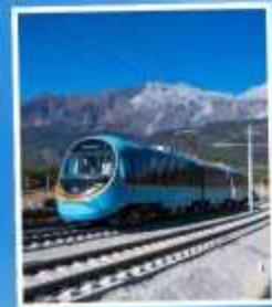
รถไฟชมวิวย ภูเขาหิมะมังกรหยก