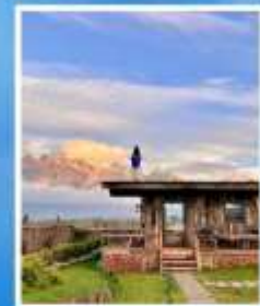
YUN DI AN CAFE