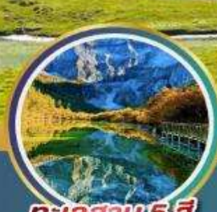
ทะเลสาบ 5 สี