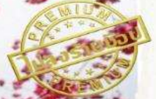
ทุ่งดอกทุ่งดอก มัสตาร์ด