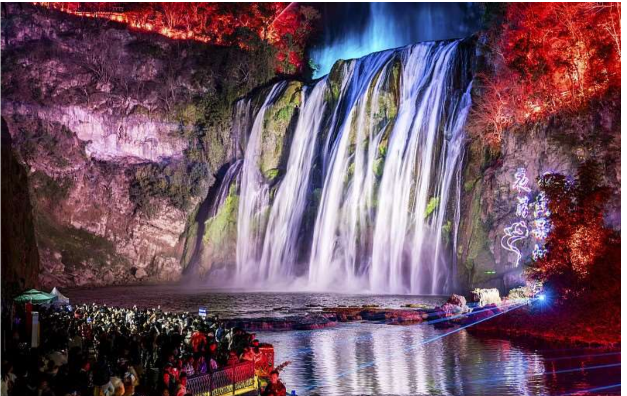
A colorful night view is captured at the Huangguoshu Waterfall scenic area, Anshun, Guizhou Province. https://news.cgtn.com/news/2024-05-30/Night-Tour-at-Huangguoshu-show-takes-visitors-on-a-colorful-trip