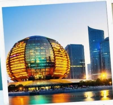
HANGZHOU CITY BALCONY