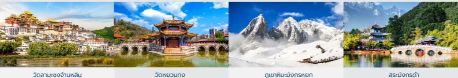
วัดลามะชงจันหลิน