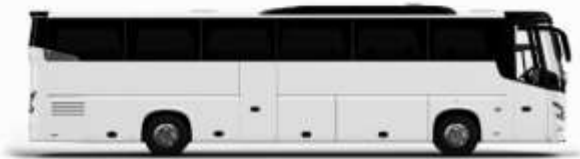
ตัวอย่างรถทัวร์ 1 คัน

ค่าที่พักตามที่ระบุในรายการหรือเทียบเท่าระดับเดียวกัน (ห้องพักละ 2 ท่าน) หากประเภทห้องพักที่ระบุไว้ไม่มีในรายการ เช่น วิววิวห้องพักเป็น TWIN BED หรือ DOUBLE BED ทางบริษัทขอสงวนสิทธิ์ในการปรับประเภทห้องพัก เป็นตามที่โรงแรมมีอยู่ โดยไม่ต้องแจ้งให้ทราบล่วงหน้า