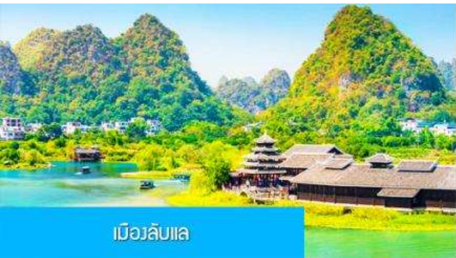
เมืองลิบแล