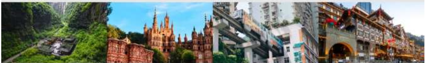
อุทยานแห่งชาติหลุมฟ้า 3 สะพานสวรรค์ Hua Sheng Yuan Dream Castle รถไฟฟ้าทะลุติ๊ก หงหยาดิง