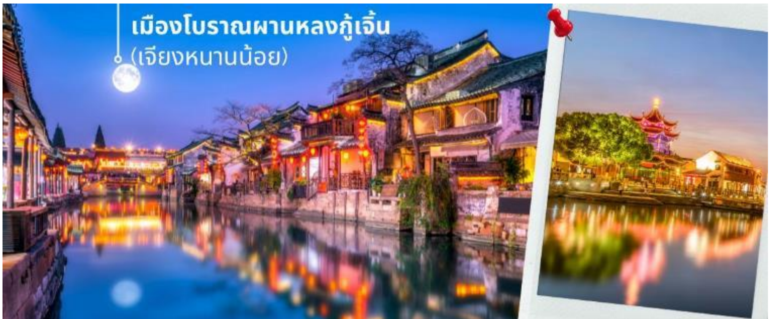
เมืองโบราณผานหลงกุ้เจิน (เจียงหนานน้อย)

แวะร้านอาหาร ชมของฝาก สินค้าขึ้นชื่อของเมืองจีน จากนั้นนำท่านชม เมืองโบราณผานหลงกุ้เจิน (เจียงหนานน้อย) เมืองโบราณทางตอนใต้ของแม่น้ำแยงซี ตั้งอยู่ในพื้นที่หวงเจียวตะวันตก ใช้เวลา ขับรถเพียง 5 นาทีจากศูนย์นิทรรศการ และการประชุมแห่งชาติ (เซียงไฮ้) เมืองผานหลงตั้งอยู่ทางฝั่งตะวันตกของท่าเรือผานหลง และปัจจุบันเป็นที่ตั้งของ คณะกรรมการย่านผานหลงของเมืองซูจิง เขตชิงฝู่ ผานหลงกั้งเป็น 1 ใน 5 สระน้ำหลักบนแม่น้ำอู่ชิ่งในสมัยโบราณ คด