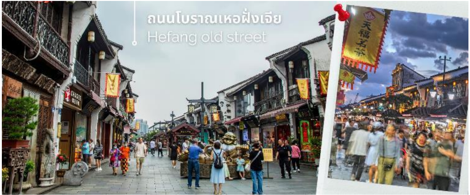
ถนนโบราณเหอฝิงเจีย Hefang old street

จากนั้นนำท่านเดินทางชม ถนนโบราณเหอฝิงเจีย เป็นส่วนหนึ่งของย่านคึกคักโบราณ "ชิงเหอฟาง" ในเขตเมืองเก่าของ หังโจว เมืองเอกมณฑลเจ้อเจียง บริเวณตีนเขาอู่ชาน ถนนมีความยาว 1,800 เมตร กว้าง 13-32 เมตร ในอดีตบริเวณสี่ มุมถนนที่เป็นจุดตัดของถนนเหอฟางเจียกับถนนจงซานจงลู่ ถือเป็นหัวใจของย่าน ที่นี่เป็นถนนคนเดิน นักท่องเที่ยวจะได้ พบกับประวัติศาสตร์และวัฒนธรรมอันเก่าแก่ของหางโจวได้อย่างดี บ้านเรือนทั้งสองข้างทางที่สร้างขึ้นใหม่ล้วนสร้างจาก