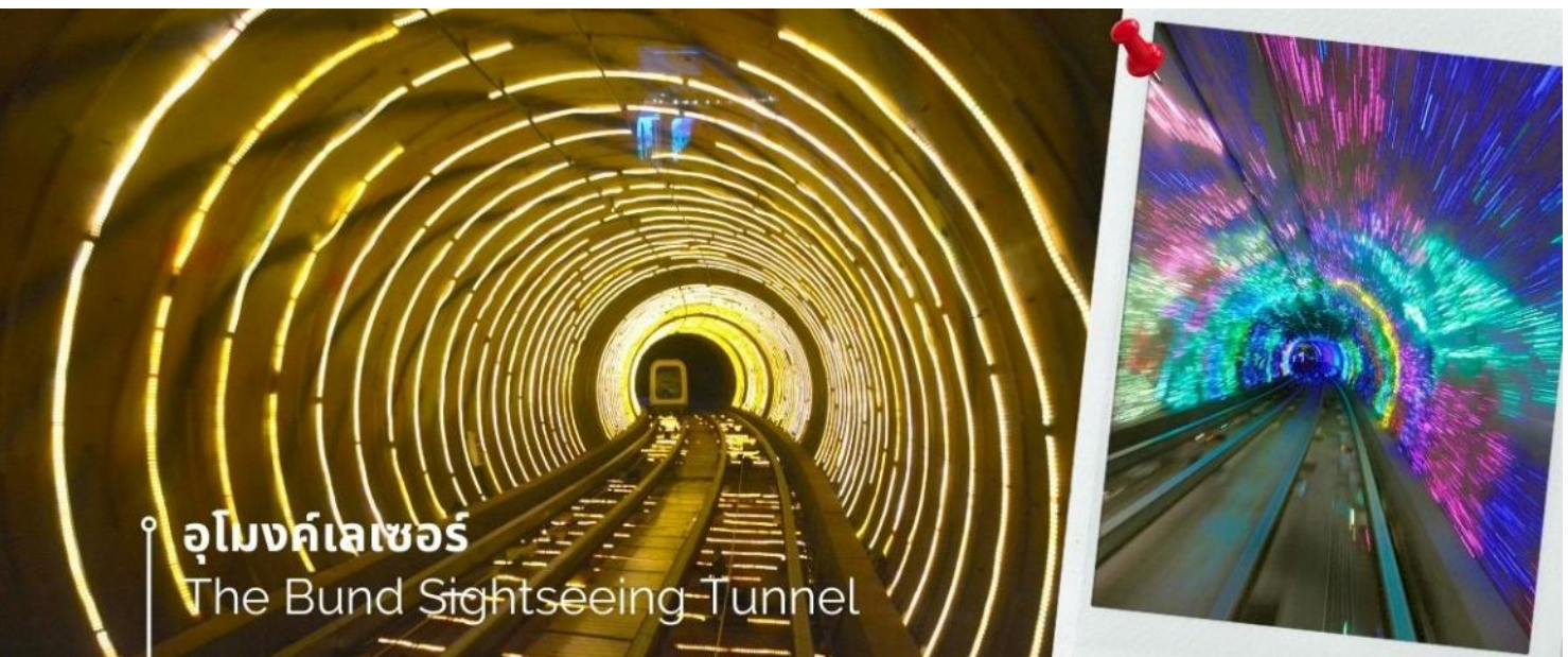
📍 อุโมงค์เลเซอร์ The Bund Sightseeing Tunnel

จากนั้นนำท่านเปิดประสบการณ์ใหม่กับ The Bund Sightseeing Tunnel อุโมงค์เลเซอร์ เซี่ยงไฮ้ ถูกสร้างขึ้นเพื่อให้ใช้เป็นเส้นทางขนส่งนักท่องเที่ยวกลุ่มใหญ่ๆ ที่มาเที่ยวที่นครเซี่ยงไฮ้ ทางการเซี่ยงไฮ้ได้ติดตั้งระบบแสงสีเสียงสุดอลังการภายในอุโมงค์แห่งนี้ ทำให้ช่วงเวลาระหว่างอยู่บนรถอัตโนมัติภายในอุโมงค์แห่งนี้ เหมือนอยู่ในอีกโลกหนึ่ง