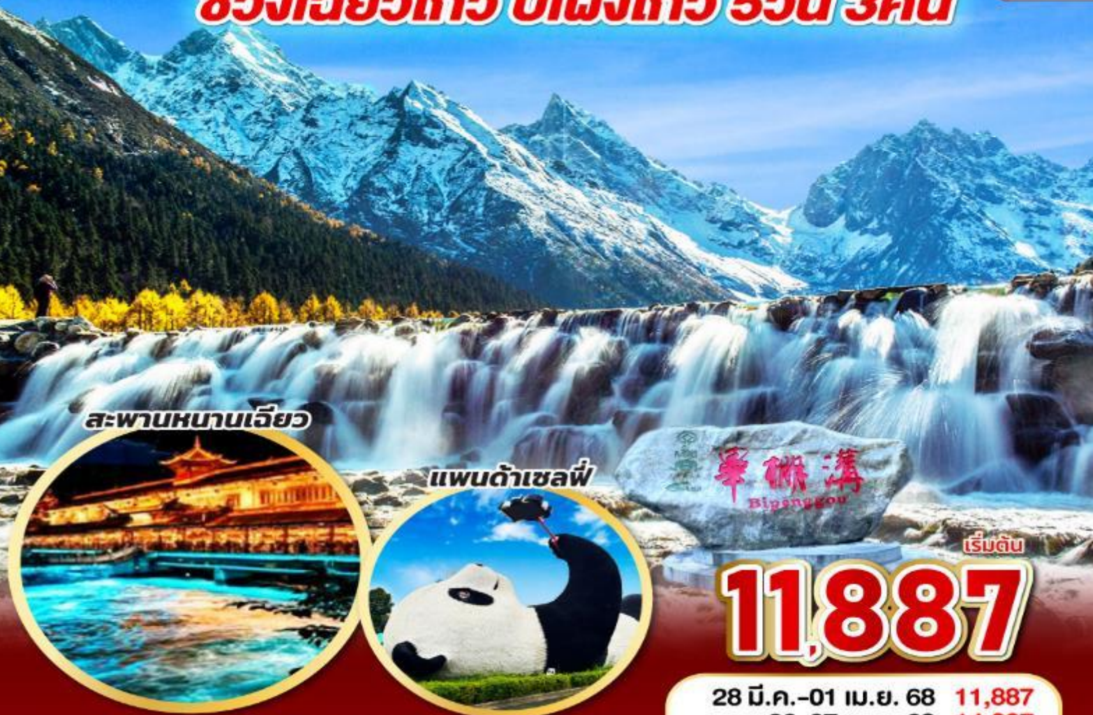
สะพานหนานเจียว

ประกันสุขภาพฟรี-00 คุ้มครองสูงสุด 3,000,000 www.airasia.com