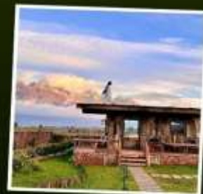
YUN DI AN CAFE