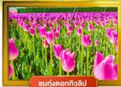
ชมทุ่งดอกทิวลิป