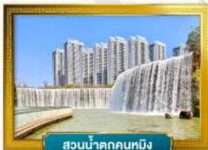
สวนน้ำตกคุนหมิง