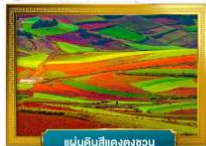
แผ่นดินสีแดงตงชวน