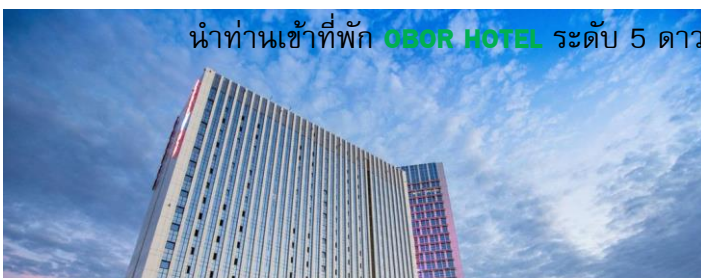
นำท่านเข้าพัก OBOR HOTEL ระดับ 5 ดาว หรือ เทียบเท่า

ในเขตทะเลทราย และในซินเจียง เดือน เมษายน-พฤษภาคม พระอาทิตย์จะตกดิน 19.00 – 20.00 น เดือนกรกฎาคม-สิงหาคมพระอาทิตย์จะตกดินประมาณ 21.00-22.00 น.ส่วนเวลาที่ท่องเที่ยวจึงทำได้