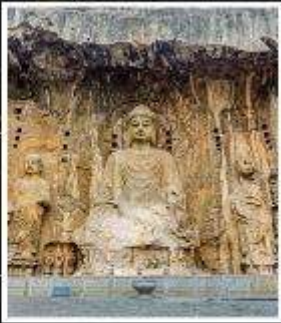
พระพุทธรูปแกะสลัก หินหลงเหมิน