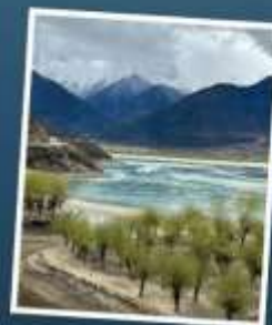
อุทยานเขาเป็นยี่