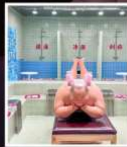
คาเฟ่ย้อนยุคเหอผิง