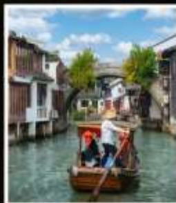
เมืองโบราณ จูเจียเจี้ยว